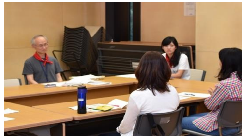
2) 子育てに関する自信回復を目的にした専門家によるグループカウンセリング「親の会」