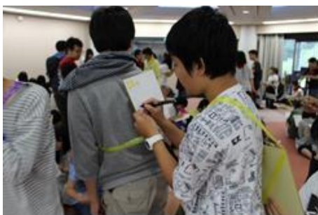
3) 感謝の気持ちを伝えあう「色紙づくり」